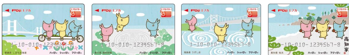
愛媛県/しまなみ海道

【参考】中四国6県の観光名所や特産品をデザインした「ご当地エフカ」を発行しています。